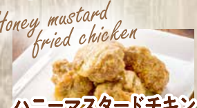
ハニーマスタードチキン 600yen