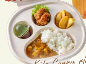
Kids Curry rice