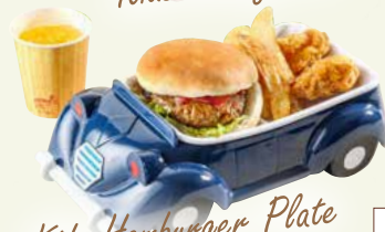
Kids Hamburger Plate