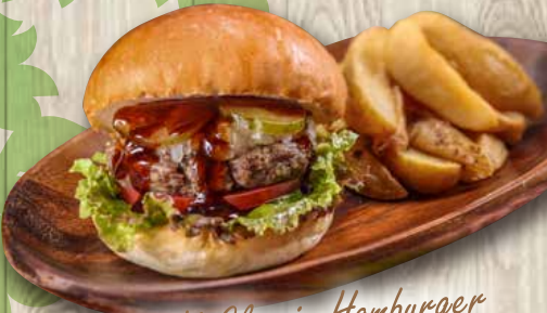
OAK Classic Hamburger