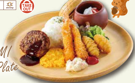
KONOMI Kids Plate