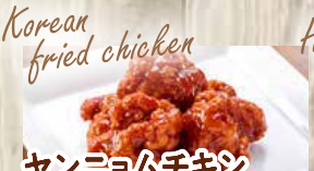
ヤンニョムチキン 600yen