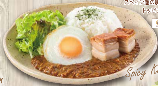
Spicy Keema Curry