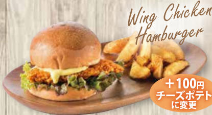
Wing Chicken Hamburger