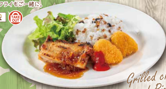
Grilled chicken and Rice Plate