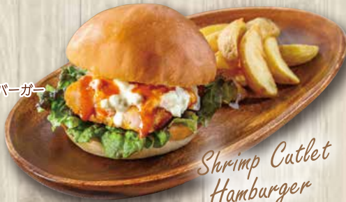
Shrimp Catlet Hamburger